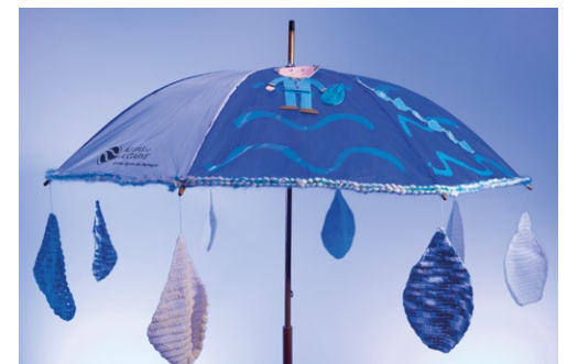
Centro Paroquial de Paderne Paderne Centro de Dia - Sénior