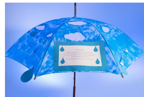
Instituto D. Francisco Gomes – Casa dos Rapazes Faro Casa dos Rapazes