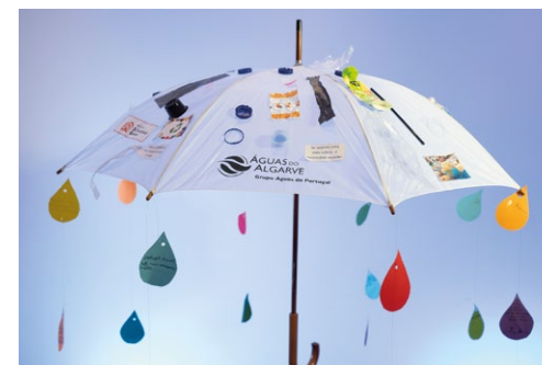
Santa Casa da Misericórdia de Albufeira Albufeira Projeto ECOS - Oficina Ecológica de Cooperação Social