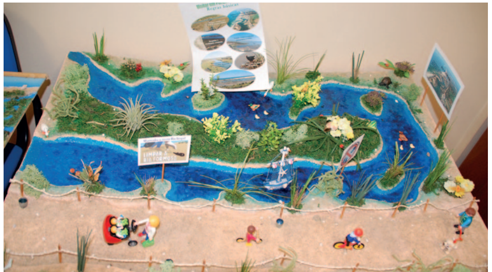
Um dos Projetos a concurso

O Concurso Água Jovem é promovido pela Águas do Algarve, S.A., Agência Portuguesa do Ambiente e Mundo Aquático SA (Zoomarine), contando ainda com o apoio do Grupo Hubel.