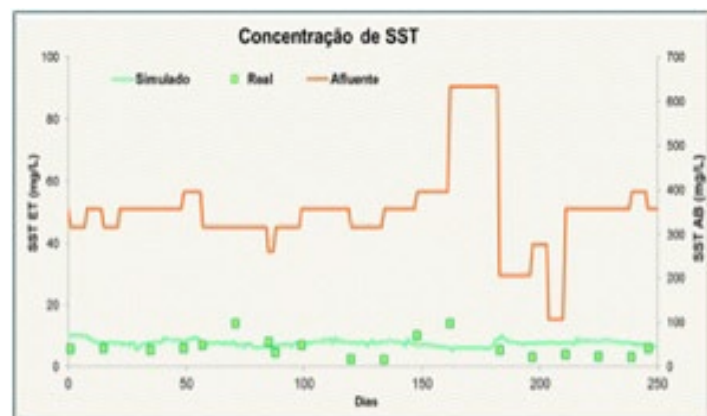
Exemplo de comparação entre os valores de CQO e SST reais (afluente e efluente tratado) e os valores obtidos do modelo (efluente tratado)