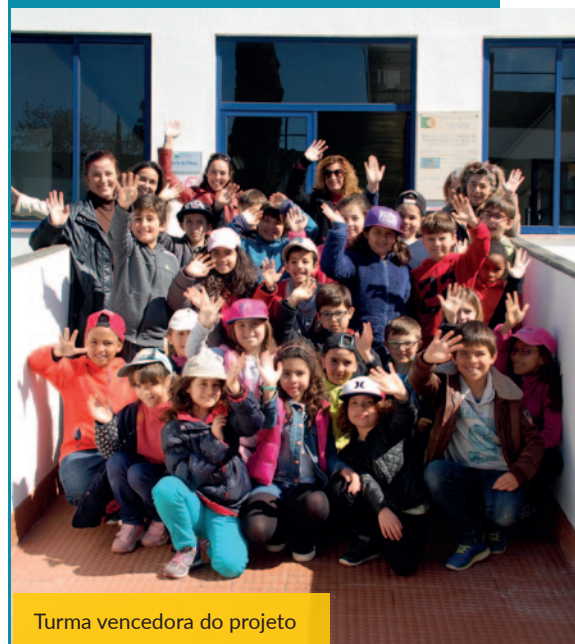
Turma vencedora do projeto