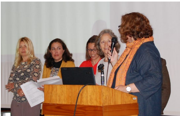
Cerimónia de Entrega de Prémios