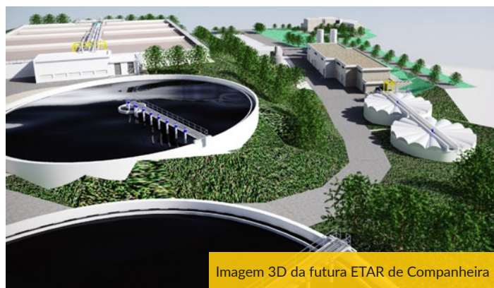
Imagem 3D da futura ETAR de Companheira

Desta forma a construção da ETAR da Companheira constitui-se como uma importante garantia para o desenvolvimento das atividades económicas da região.