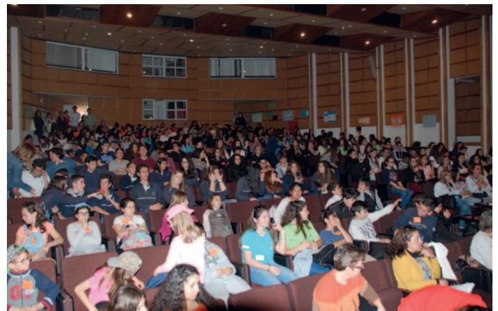
Sala Cheia na entrega de prémio