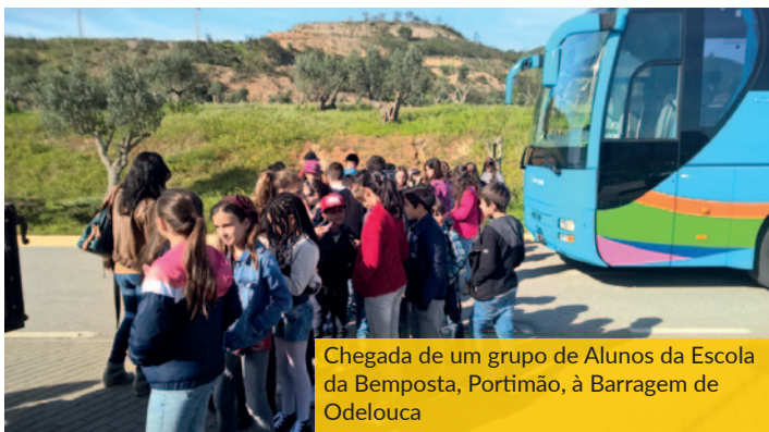
Chegada de um grupo de Alunos da Escola da Bemposta, Portimão, à Barragem de Odelouca

posto, levámos a efeito a ação Portas Abertas, de algumas das nossas mais importantes infra-estruturas: Barragem de Odelouca, ETA de Tavira e Alcantarilha, ETAR de Albufeira Poente e Almargem. Nesta ação, a AdA recebeu cerca de 345 visitantes, oriundos dos vários concelhos da região, e de todas as faixas etárias da população.