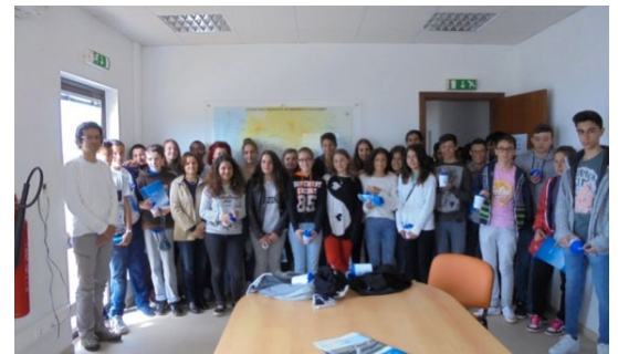
Visita dos alunos à ETAR Albufeira Poente