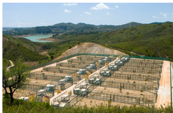
Cercado do CNRLI construído pela AdA

O Projeto Nova Serra foi acordado entre a AdA, o Instituto de Conservação da Natureza e das Florestas, os municípios de Silves e de Monchique, a Agência de Desenvolvimento do Barlavento e a Natura XXI do Grupo Pestana, tendo a assinatura do protocolo, ocorrida no dia 28 de janeiro, na Quinta Pedagógica de Silves.