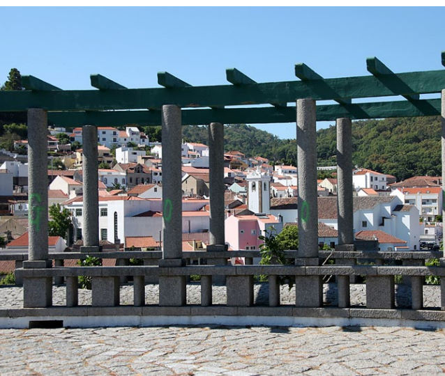
Vista parcial de Monchique