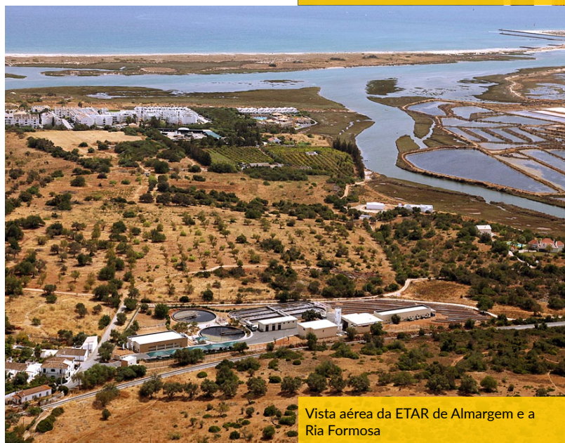
Vista aérea da ETAR de Almargem e a Ria Formosa