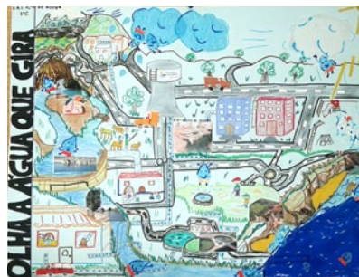
Trabalhos já apresentados a concurso