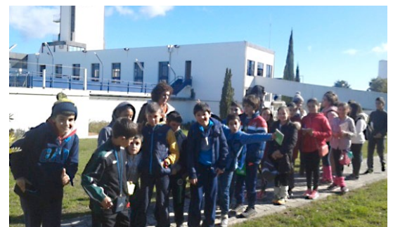
Visita ETA de Tavira alunos 5.º ano S. Brás