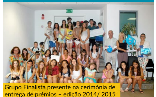
Grupo Finalista presente na cerimónia de entrega de prémios – edição 2014/ 2015

Para a inscrição basta enviar o nome do/as autor/as, indicação da escola/instituição e e-mail de contacto para paula.vaz@apambiente.pt