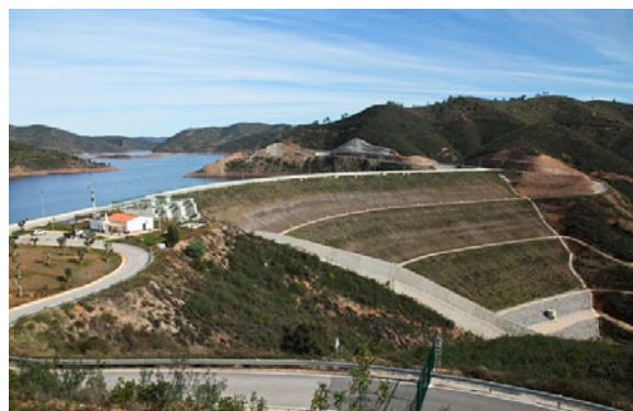
Vista lateral da Barragem e Odelouca construída pela AdA