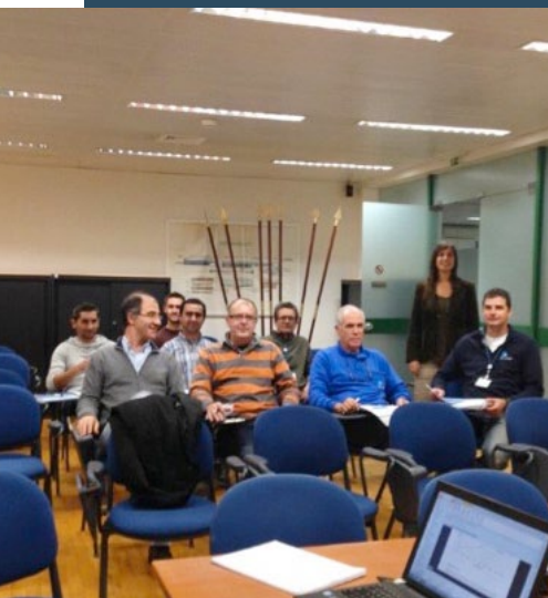
Formação hidráulica ETA de Alcantarilha

Estas ações foram ministradas pela Academia das Águas Livres – EPAL e contaram com a participação de colaboradores da AdA de diferentes áreas da empresa, bem como o Prestador de serviços da área da Manutenção (Bewater). A AdA através do convite dirigido às entidades gestoras em baixa, possibilitou que os técnicos das entidades que acederam ao convite participassem nas ações, nomeadamente, técnicos da CM de Monchique, da Inframoura, EM e da Tavira Verde, EM. Nestas ações participaram 20 colaboradores da Direção de Operações Água, 3 da Direção de Infra-estruturas – Manutenção, e 14 técnicos dos prestadores de serviços (Bewater) e ainda 8 técnicos de entidades gestoras em baixa.